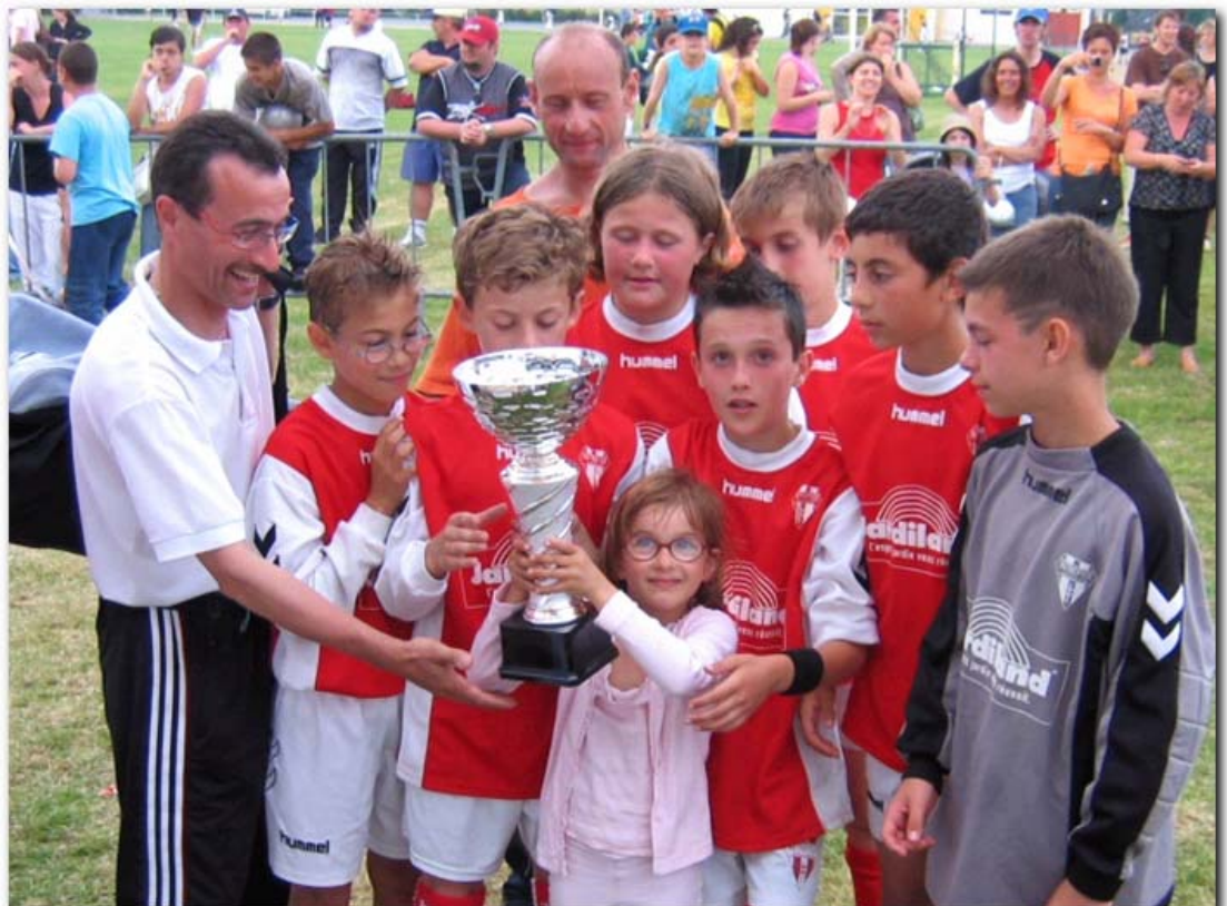
Benjamins Angers Intrépide – Vainqueur 2007