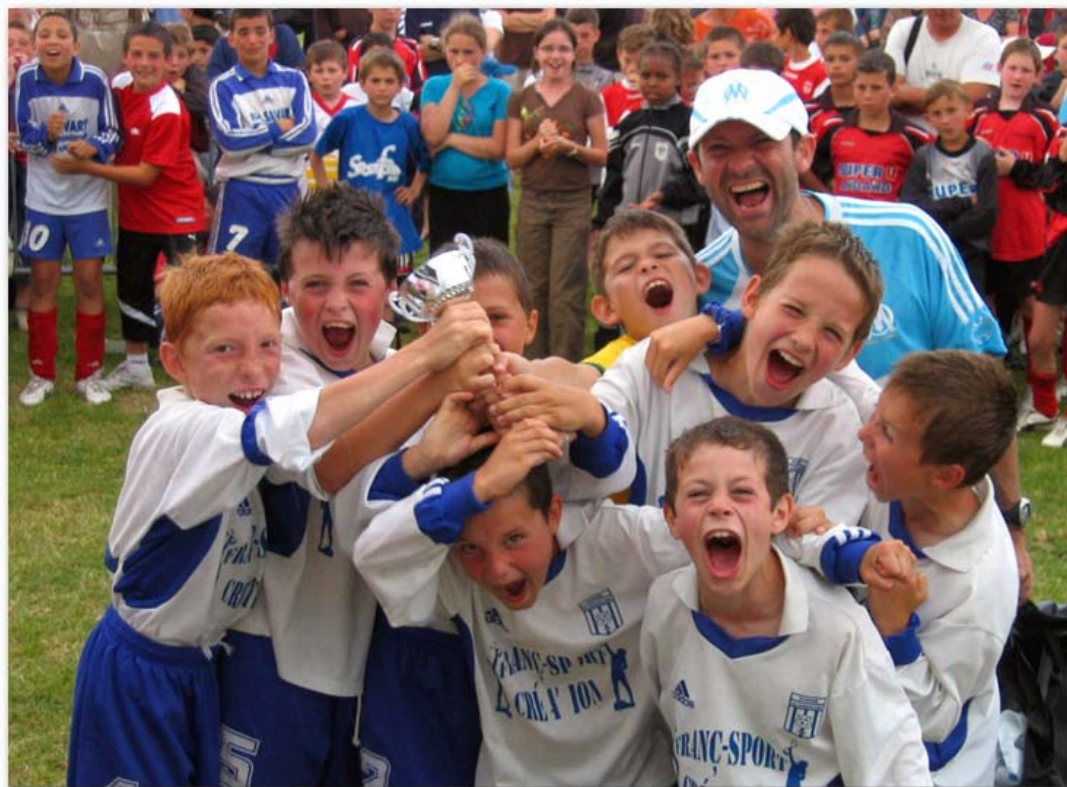
Poussins GJ Ste Gemmes – Vainqueur 2007